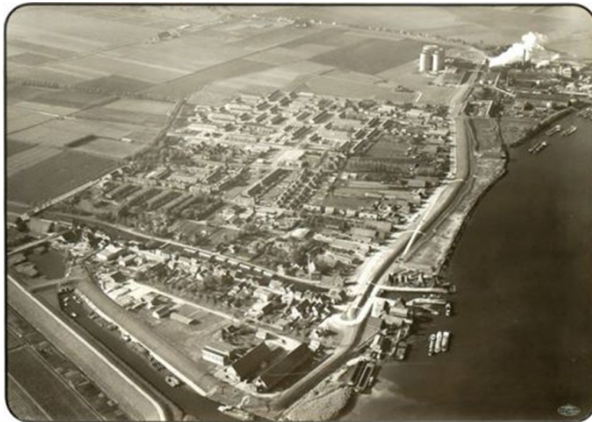
Luchtfoto van Puttershoek uit 1960 Er lagen toen al wel bootjes in het Lorregat.

Foto's van mister Google: Vroeger in Puttershoek